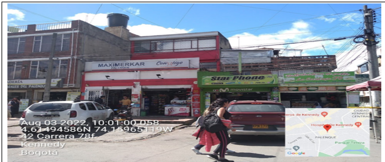
Vista panorámica del predio en el que se sitúa el establecimiento comercial denominado MAXIMERKAR PALENQUE ubicado en la CR 78 F No. 42 – 16 SUR .